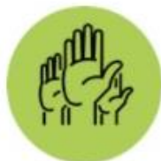
FAMÍLIES I PARTICIPACIÓ

Per treballar l'àmbit d'educació hem creat tres comissions formades per professionals dels recursos del barri i representants de les entitats i associacions, que treballen per donar forma a les propostes de millora del barri.