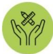
SUPORT AL SISTEMA EDUCATIU