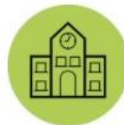
CENTRES EDUCATIUS I COMUNITAT